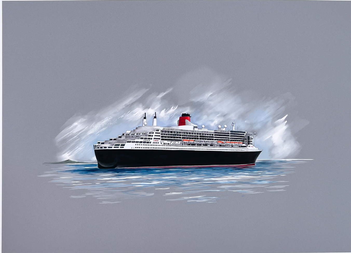
RMS Queen Mary 2